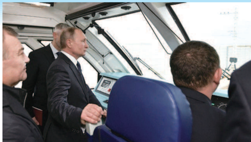
普京在开过大桥的火车驾驶室

2014年克里米亚和塞瓦斯托波尔市举行公投,超过九成投票者同意脱离乌克兰,加入俄罗斯。普京与两地代表签署条约,允许两地以联邦主体身份加入俄罗斯联邦。但乌克兰不承认公投,西方因此对俄罗斯实施制裁。