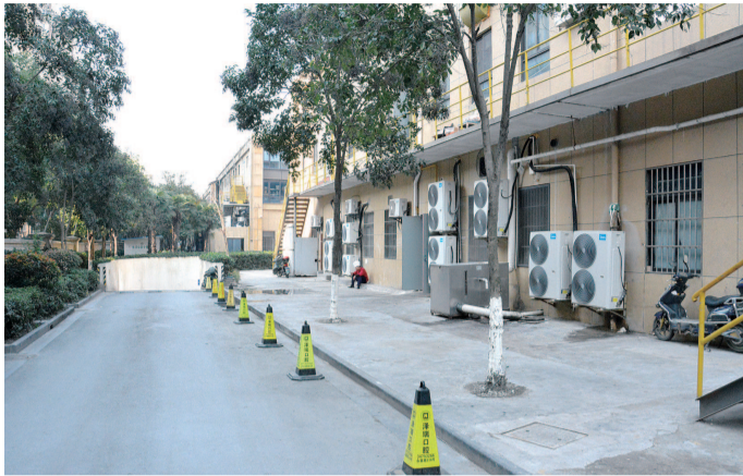
整治后的街道背面整洁多了

垃圾遍地、污水横流、占道经营、乱堆杂物,地面还结起一层厚厚的油污,再加上油烟、噪声,与小巷只有一墙之隔的枫桦景苑、虹梅新苑等小区的居民叫苦不迭,“这个地方脚都插不下去”。