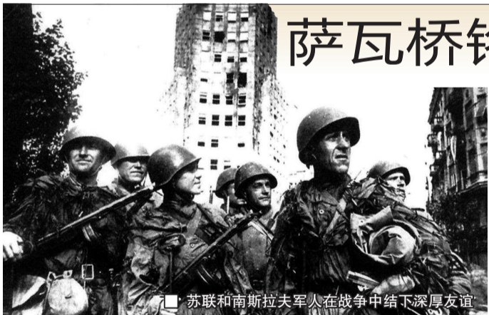
■ 苏联和南斯拉夫军人在战争中结下深厚友谊