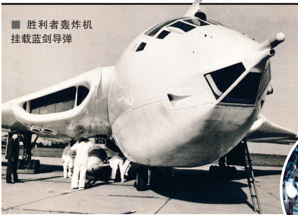
■ 胜利者轰炸机 挂载蓝剑导弹