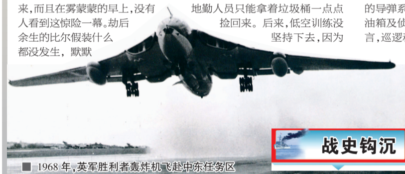
■ 1968年，英军胜利者轰炸机飞赴中东任务区

马岛战后，胜利者机群也耗尽了大部分机体寿命，进入休眠期。1991年，第55中队解散，胜利者飞机就此告别历史舞台。罗淦