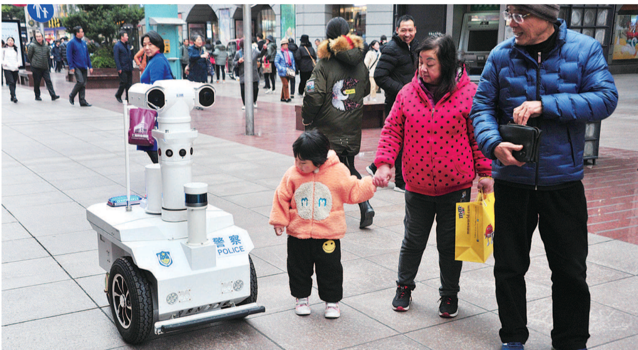
■警用巡逻机器人出现在南京路步行街,不时提醒市民注意街面防盗,这让一对带着孙女逛街的老夫妇感到很新鲜