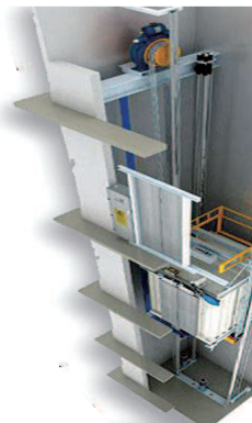
新民图表制图 叶聆