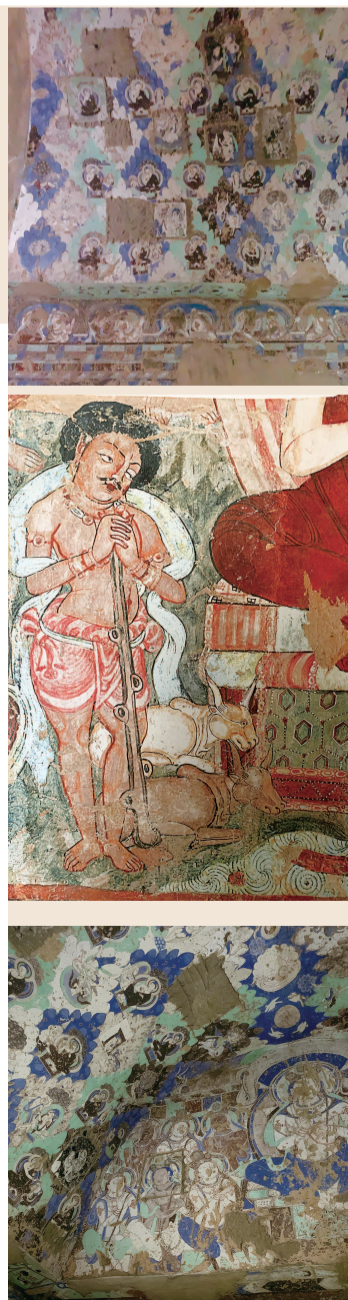
龟兹石窟壁画艺术展部分展品

“丝路遗韵·五彩龟兹——龟兹石窟壁画艺术展”由新疆龟兹研究院、青浦区博物馆、上海中华印刷博物馆联合举办。 本报记者 徐翌晟