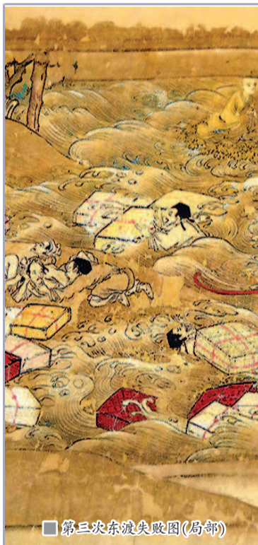
第三次东渡失败图(局部)

强大的人,所以他的作品里,始终有一个内核——相信自己,内心的强大足以改变故事的结局,“我是我命运的主宰”。