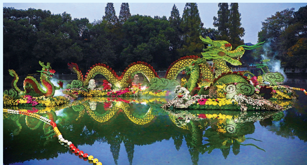
银奖《五龙汇潭耀九州》