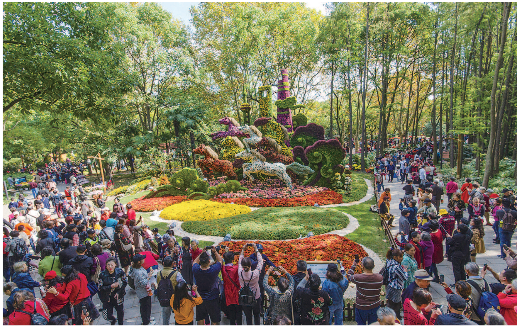
金奖《七匹奔腾的骏马》