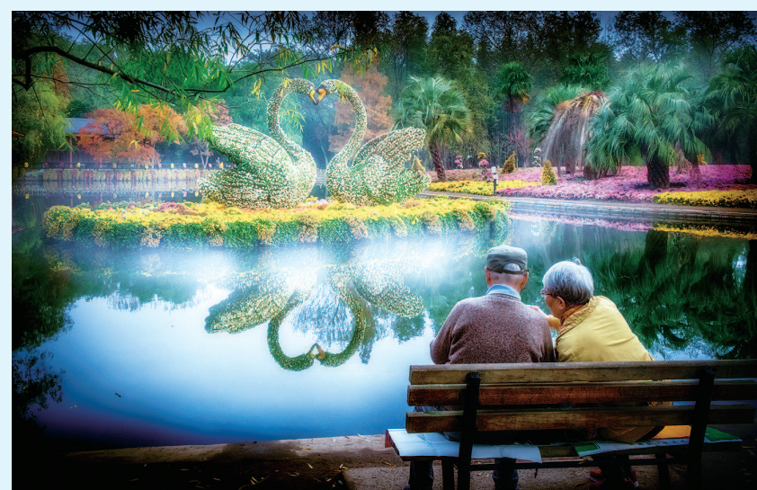
银奖《不羡天鹅只羡你》