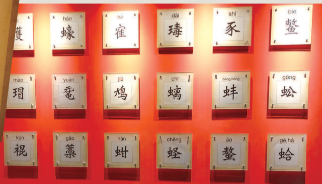
《海错图》中的海鳐