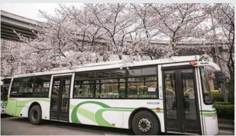
南浦大桥浦西公交枢纽站

公共交通站点是城市的一扇窗口。每天载客流量高达1000多万的上海地铁如此,散布于公路旁的公交站点如此,上海的虹桥、浦东两大机场,以及上海站、上海虹桥站、上海南站等火车站亦是如此。