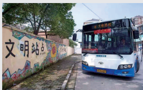
大桥四线双桥路站点