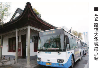
六六路恒华城终点站

当然,公交车站的服务亦很重要。虽然一些站点样貌普通,但优质的服务使得它们具有了“最美”的内涵。比如,40路