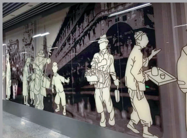
南京东路站的老上海风情展示

上海最美公共交通站点层出不穷,不断带给人们耳目一新的感受和体验。看得见的创意,听得见的音乐,悟得到的精神,学得到的知识,感受得到的文化氛围,体验得到的服务温度,让上海公共交通站点与其他城市景观共同构成了“海纳百川”的新文脉,织就上海创意的新名片,在全面打响上海“四大品牌”,建设全球卓越城市的进程中发挥出独特的影响力。