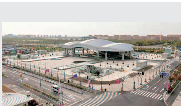
滴水湖交通枢纽站