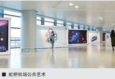
虹桥机场公共艺术

正如城市学家所言:要想彻底了解一个城市,必须亲自感受它的地铁。一座座地铁站已然成为人们了解“在地”特色的一扇扇的艺术文化窗口。