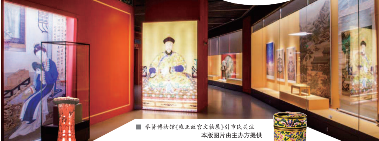
■ 奉贤博物馆《雍正故宫文物展》引市民关注 本版图片由主办方提供