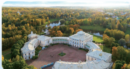
巴甫洛夫斯克国家博物馆保护区