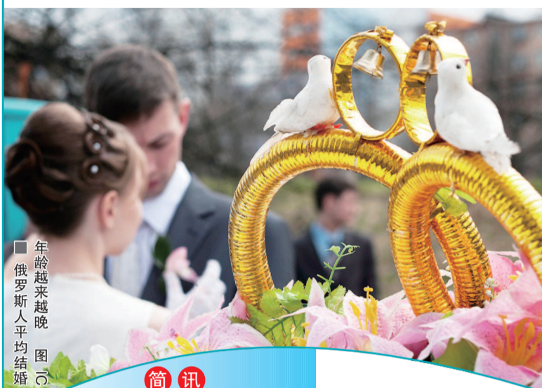
俄罗斯人平均结婚年龄越来越晚 图

女性传统上希望拥有家庭,专家也发现了近年来的两个现象:一是,年纪较大且事业成功的女性往往更愿一个人生活;二是,35岁以后结婚的女性人数在逐渐增加。