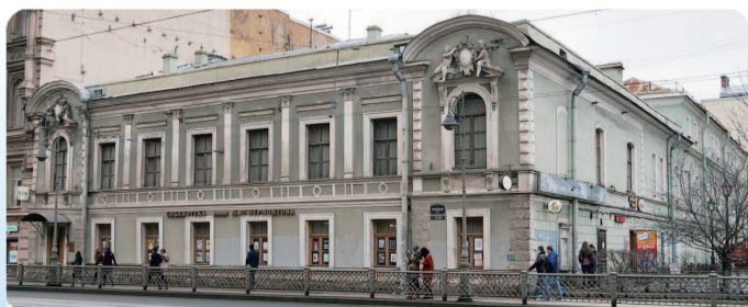
莱蒙托夫中央图书馆