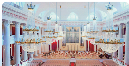
肖斯塔科维奇圣彼得堡爱乐乐团