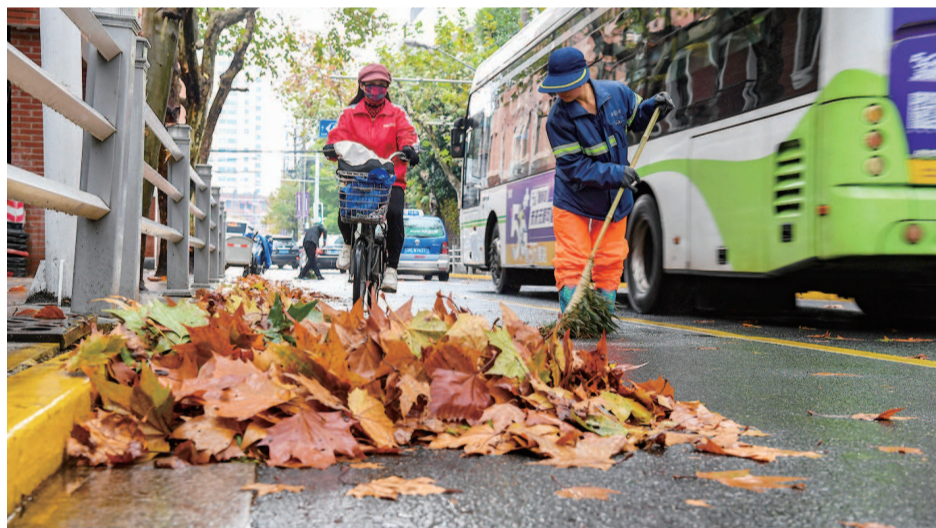
■ 今天一早,环卫工人清扫被寒风吹落的树叶

据上海中心气象台预报,此轮冷空气将使申城气温再下一个台阶,并催动首轮入冬倒计时。下周中,市区最低气温仅有3℃,郊区0℃左右,最高气温也会跌破10℃。气象专家提醒,天气晴冷,昼夜温差大,容易引发心脑血管等疾病,易感人群请做好防护。