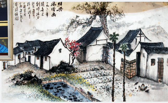
赵丹画作《绍兴风俗图》