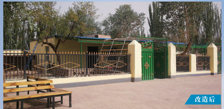
改造后的巴楚县阿纳库勒乡昆其买里村