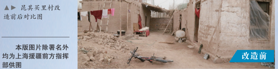
▲▲ 昆其买里村改造前后对比图

的村民马木提·尼牙孜说。以往一家人睡“大通铺”,什么都习惯在地毯上解决,现在屋内则有独立的客厅、卧室、卫生间,再加上庭院面积,每户有400平方米。因为有政府补助以及援疆资金的扶持,马木提一家入住新房只要花25000元,“现在交了13000元,剩下的明年继续交”。