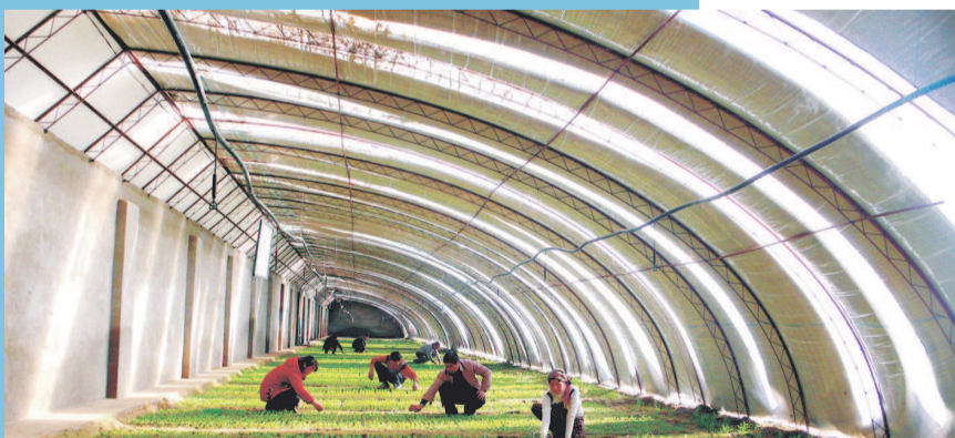
■ 上海在莎车援建的“大棚工厂”