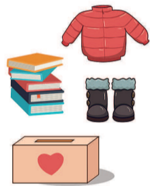
新民图表 董春洁 制图