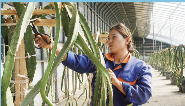
■ 扶贫产业园里的火龙果试种成功了