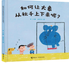
《如何让大象从秋千上下来》

如何让大象从秋千上下来呢?请它吃香蕉?把它吓一跳?让风吹跑它?让外星大象带走它……小朋友们开动脑筋,想出了各种各样奇妙有趣的好办法。可我打赌,你一定猜不到,大象最后是怎样从秋千上下来的!