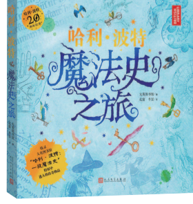
《哈利·波特 魔法史之旅》

绘本主要针对 3 至 12 岁儿童,封面封底均可开始阅读。绘本通过不同视觉切入,主角在绘本正中页汇合,风格童趣而别致,同时暗合“在探索外部世界时,映射出对自我、他人、外部世界的认知”这一主题。