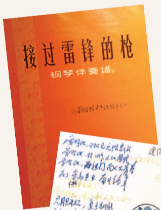
朱践耳的《接过雷锋的枪》曲谱