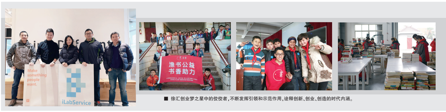
■ 徐汇创业梦之星中的佼佼者,不断发挥引领和示范作用,诠释创新、创业、创造的时代内涵。