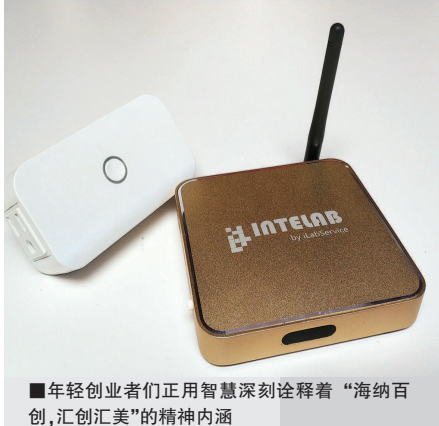
■ 年轻创业者们正用智慧深刻诠释着“海纳百川,汇创汇美”的精神内涵

第七届创业梦之星评选活动本着让生活更美好的目的,孵化出一批服务扶贫、助力科研、创造新动能的优秀项目。为了更好地响应“长三角一体化发展战略”,为创业者们搭建更广阔的平台,11月13日上午举办的长三角创业孵化基地协同发展交流活动中,徐汇区联动长三角苏州、宁波和合肥的创业孵化基地,共同探讨园区与园区、园区与创业者、创业者与创业者的深度互动机制,并发布联合倡议,共建长三角“创业孵化基地”垂直路演协同机制,推动长三角地区创新创业发展新格局。当日下午举办的第七届“创业梦之星”颁奖典礼上,不仅对优秀的创业者进行了表彰,同时来自徐汇13个街镇的相关负责人共同吹响创建创业型社区的“奋进号”。