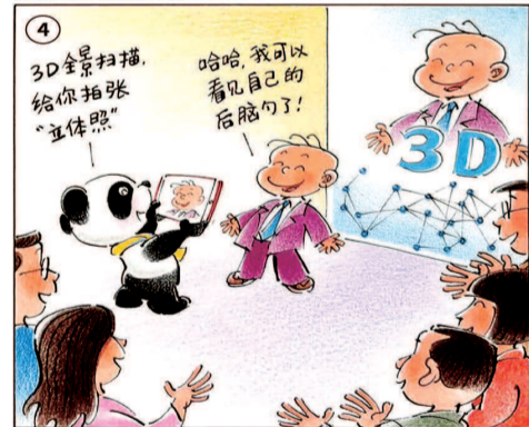
孙绍波画（三毛形象由张乐平家人授权）

酷炫的AR/VR、人工智能及机器人，先进的5G通讯、半导体及材料技术，便捷的智能家电、家居及空气净化器……未来生活是什么样子？今天，三毛来到了进博会科技生活展区。