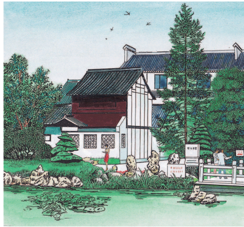
青浦练塘陈云故居(钢笔淡彩) 王世安