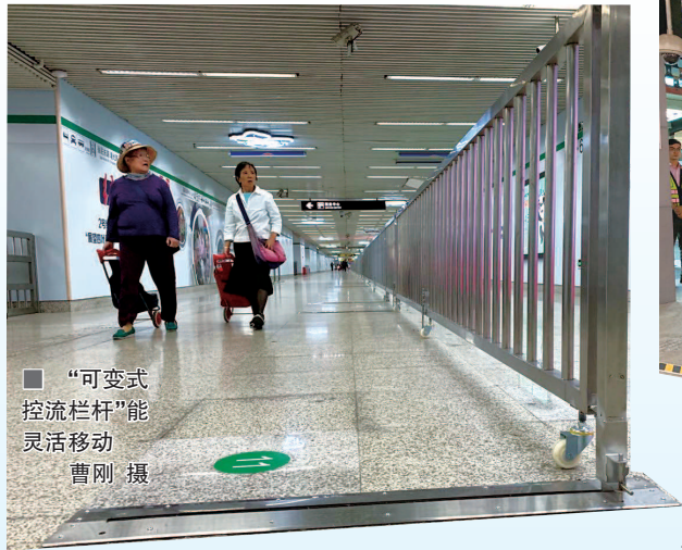
“可变式 控流栏杆”能 灵活移动