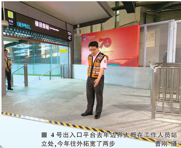
4号出入口平台去年边界大概在工作人员站 立处,今年往外拓宽了两步

轨交2号线徐泾东站,位于国家会展中心(上海)的正下方,是上海地铁直面进博会的窗口,也是考验超大型城市精细化管理的