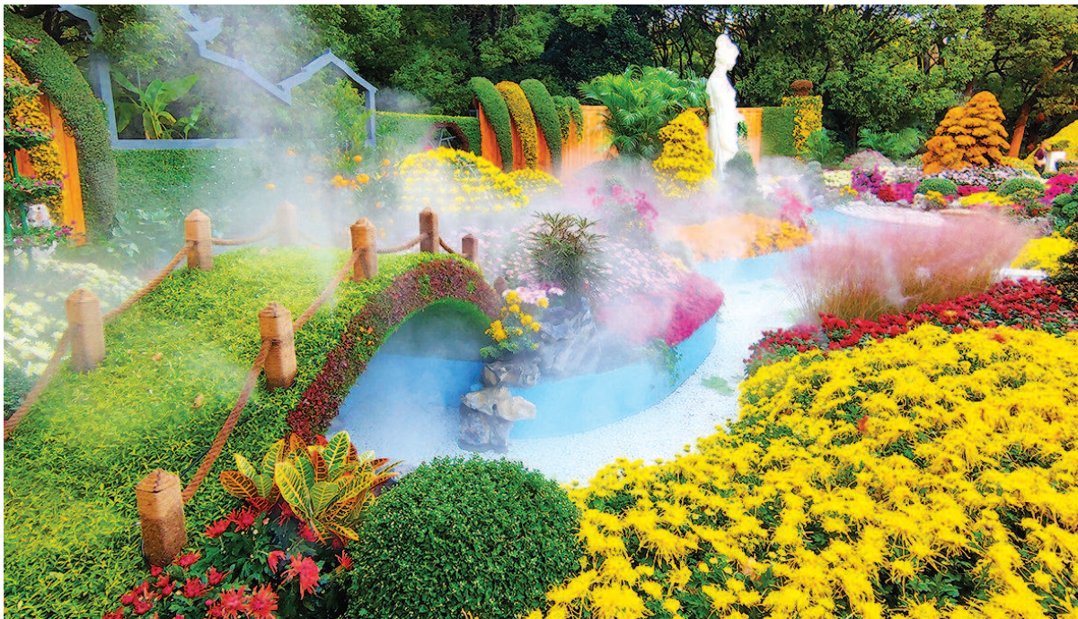
全国菊花展南京展区