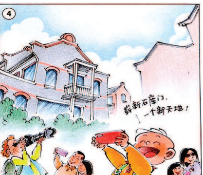
孙绍波画 (三毛形象由张乐平家人授权)

穿越到2019年的上海,转眼已经54天了,三毛从初来乍到时的陌生开始逐步熟悉,并喜欢上这个城市的每个空间。