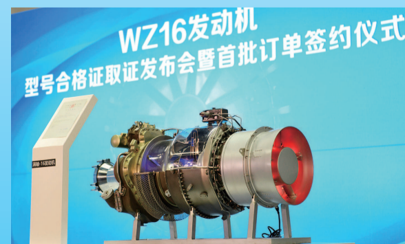
▲ 涡轴-16 发动机将是众多中国直升机的“心脏”