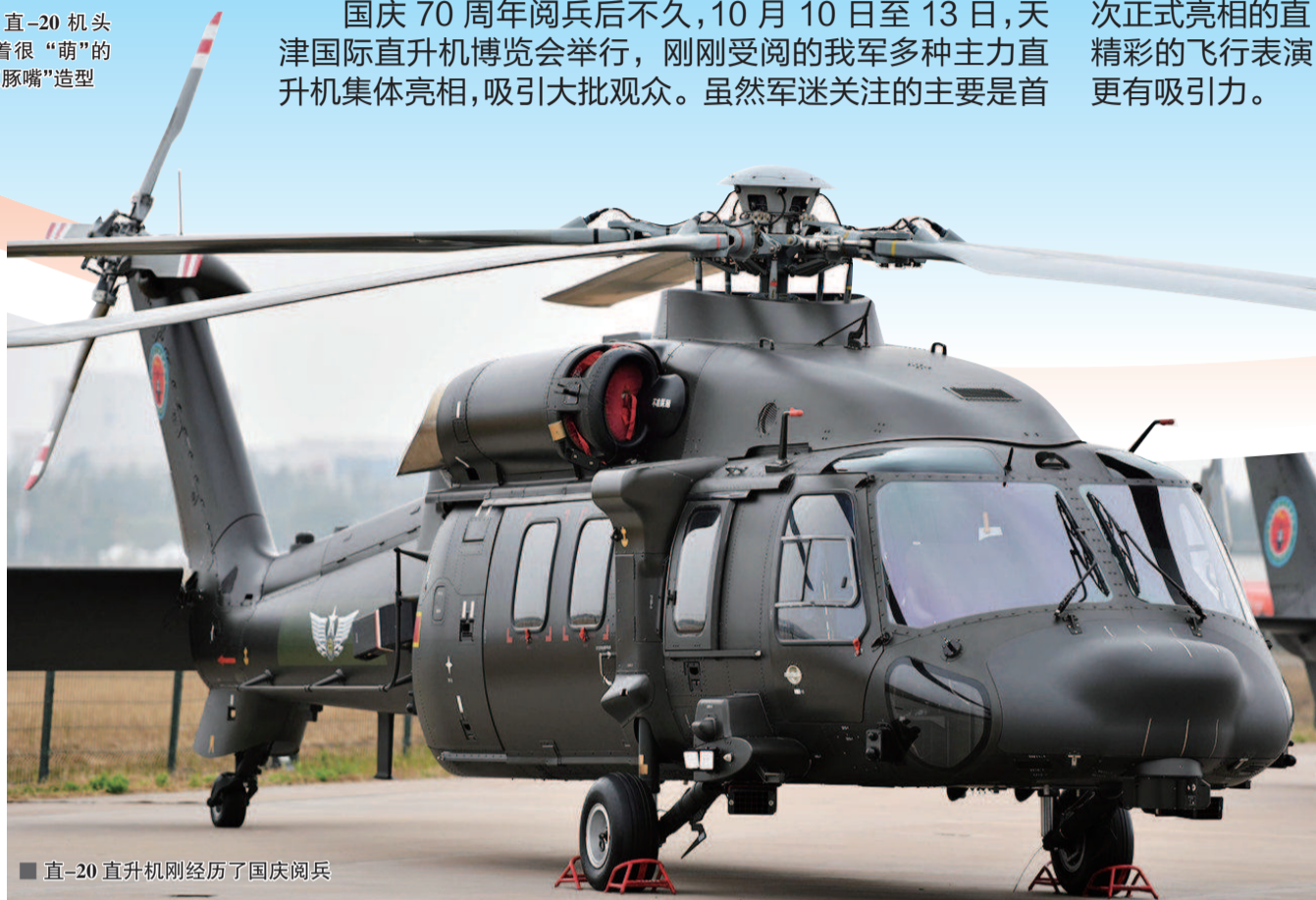
■ 直-20直升机刚经历了国庆阅兵