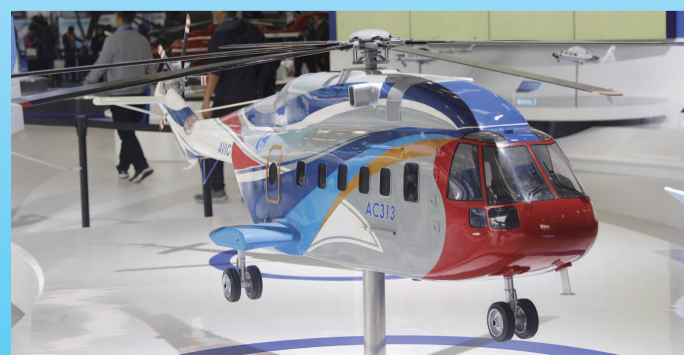
▲ 来自中航工业的 AC-313 直升机在民用领域大显身手