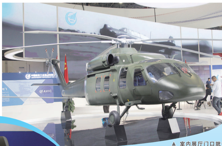
▲ 室内展厅门口就安放着直-20大比例模型