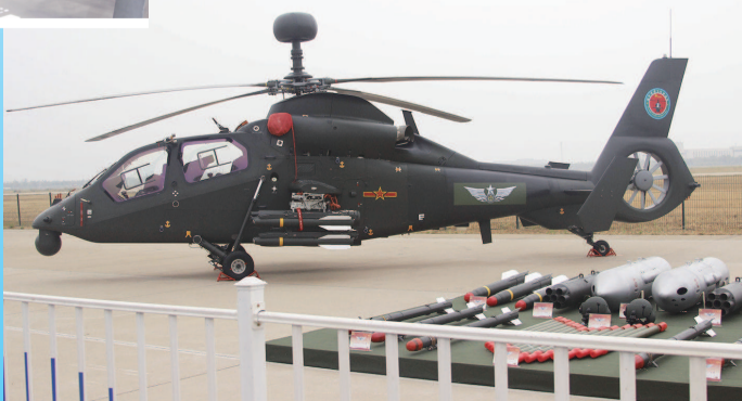
▲ 安装顶置毫米波雷达的直-19 武装侦察直升机