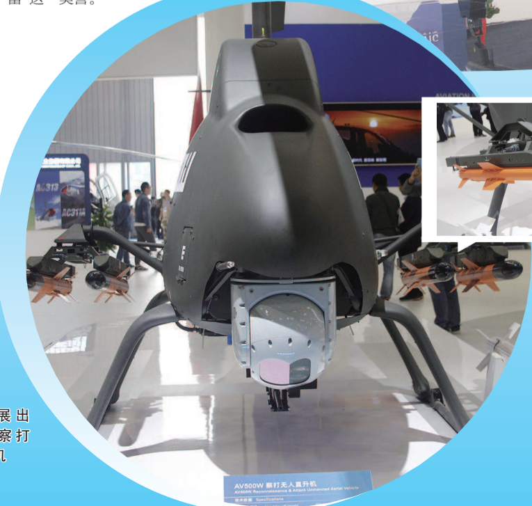
▶ 室内展出 AV500W 察打无人直升机

对于精彩的直升机飞行表演,现场观众无不惊叹叫绝。记者身旁一位女性观众通过手机兴奋地告诉“小伙伴”:“我正在看空中芭蕾,简直太好看了!”的确,和固定翼机相比,直升机的表演更加优雅飘逸,的确称得上“空中芭蕾”这一美誉。