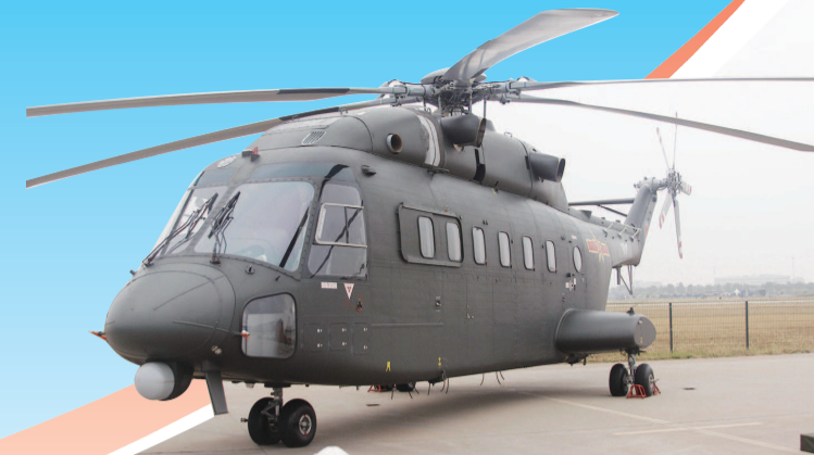
■ 引起众人热议的“超级大白鲨”直升机概念模型