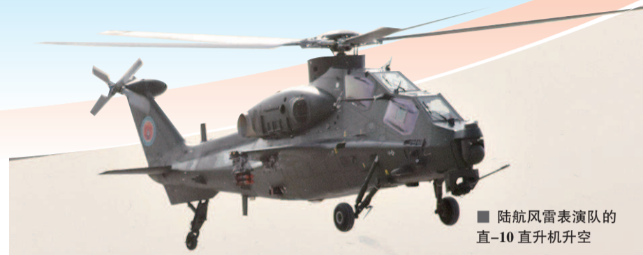
■ 陆航风雷表演队的直-10直升机升空