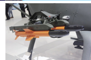
◀ AV500W 无人直升机携带的小尺寸空地导弹