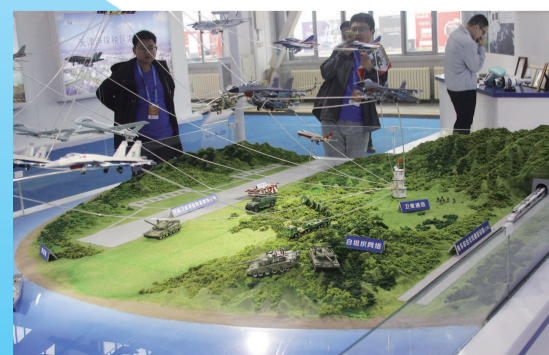
▲ 以沙盘模型展示综合无线通信网的“无限能量”