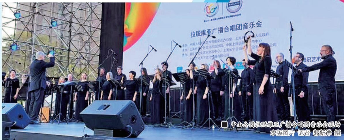
中山公园拉脱维亚广播合唱团音乐会现场

无独有偶, 当晚在“共青森林音乐节”登场的柏林广播合唱团的精彩演绎, 也由腾讯艺术频道独家直播。当约翰内斯·勃拉姆斯的《命运之歌》被唱响, 网络评论中有乐迷得意道: “有了网络直播, 远隔千里如在现场。”据悉, 昨晚两场网络直播累计有 30 余万人次观看, 同时在线观看的观众达 5 万余人次。