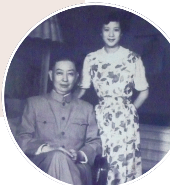
筱月英与梅兰芳合影

艺在人身，艺随人走。时至今日，戏曲的口传心授依然重要。孙正阳表示，只要学生需要，他们都会随叫随到。他也将以自己的余热，为“丑”名远扬发一分光。