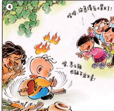
孙绍波画(三毛形象由张乐平家人授权)