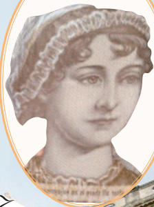
Jane Austen Festival