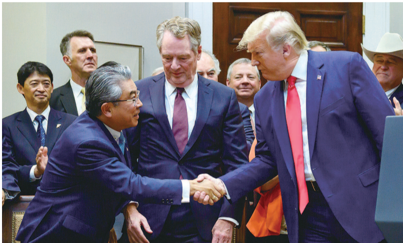
特朗普与日本驻美大使握手

“这对日美双方而言是巨大的成功。”出席签署仪式的美国总统特朗普说,“这项协议将大幅削减美国的贸易赤字,为经济增长带来最好的机会。对农民和牧场主来说,这是一个很大的转折点。”