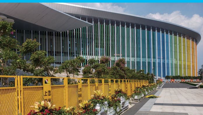
第三届中国进博会各项筹备工作进入收官冲刺阶段