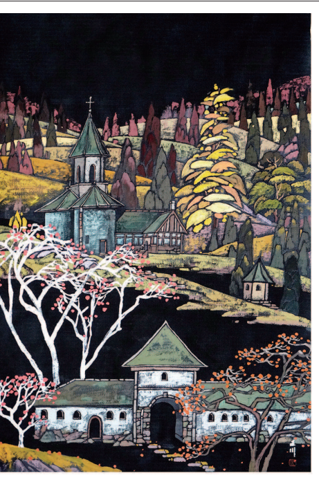
清秋 (重彩画) 王川