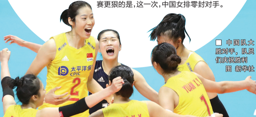
中国队大胜对手,队员们庆祝胜利

1984年洛杉矶奥运会双双登顶冠军领奖台、同一时期入选排球名人堂,当“排球女皇”郎平和“排球皇帝”基拉里再相遇,前者做到了知己知彼百战不殆,而后者多年沉迷于“光速进攻”打法始终没有主动求变。比去年世锦赛更狠的是,这一次,中国女排零封对手。