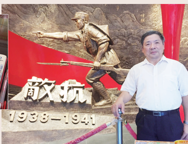
▶ 纪念地记录 ▶ 参观上海红色纪念馆、