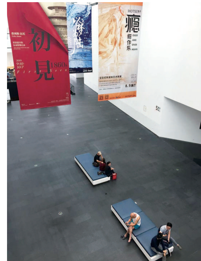
▲ 在七宝镇与艺术相遇