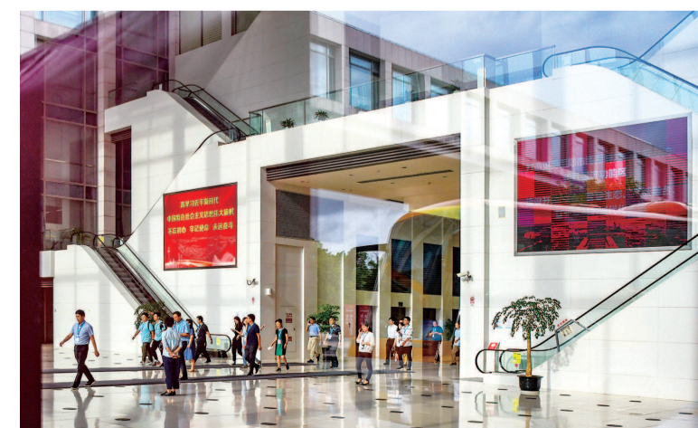
▲ 上海自由贸易试验区临港新片区成为改革开放的热土