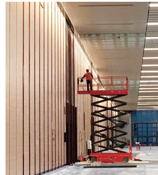
▲ 国家会展中心里的建设者