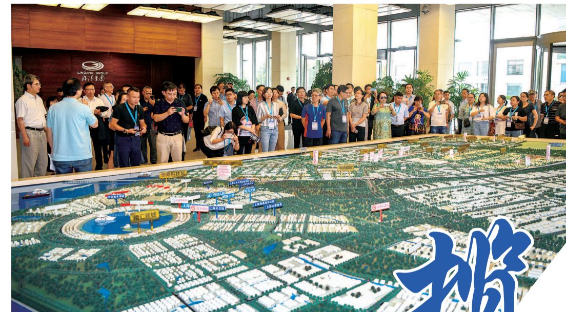
▲ 上海临港新片区的开发蓝图吸引了全国晚报人的关注