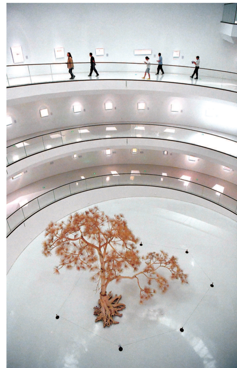
▲ 嘉宾在宝龙美术馆的公共休闲空间内,近距离感受艺术魅力