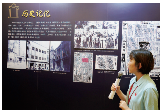
新民晚报创刊30周年,接力棒又传到了年轻一代记者手中