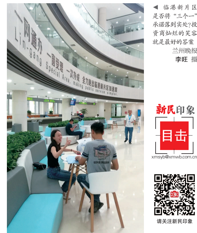
▲ 临港新片区是否将“三个一”承诺落到实处?投资商灿烂的笑容就是最好的答案