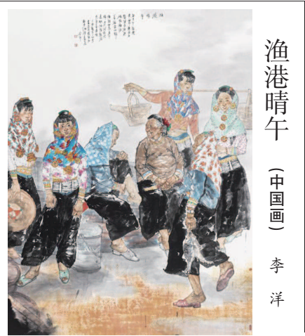
渔港晴午 (中国画) 李洋

当时正是初秋时节,北方的各种时令水果上市,青的苹果、黄的橘子、大的小的绿的紫的葡萄、圆的扁的软的硬的柿子……水果摊上满目琳琅,煞是好看。我最爱新鲜大枣,在南方不多见,北方秋季却满街都是。咬一口咯吱咯吱脆,清清爽爽的甜,比晒干的红枣好吃一百倍。还有一种圆形的梨,一个就有一斤重,粗糙的棕色果皮包裹下的雪白梨肉,细腻多汁,削皮时都能削出一手汁水,甜得跟蜜