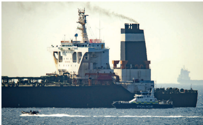
被扣押的伊朗格蕾丝一号油轮