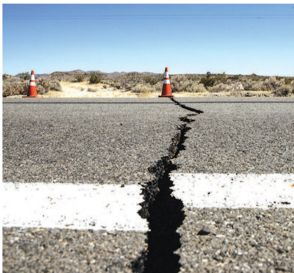
▲ 南加州道路在地震后出现裂缝 ▶ 被震落一地的超市货品