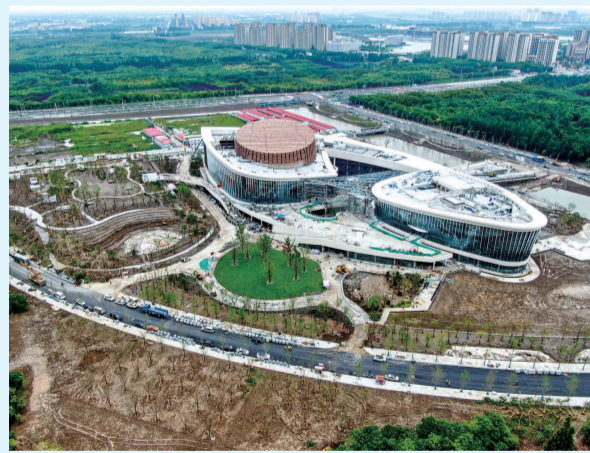
■ 九棵树(上海)未来艺术中心外景

穿二楼、三楼。”乐胜利说,这幅艺术作品中有着缤纷落下的银杏叶、梧桐叶,不仅造型凹凸立体,而且从每个视角欣赏,会有不同效果呈现。