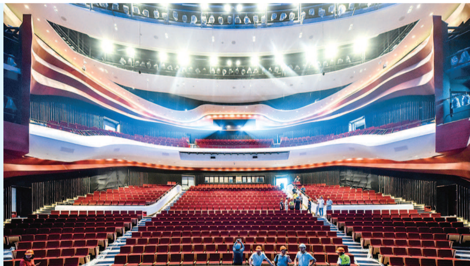
■ 南上海文化艺术地标的新名片、九棵树(上海)未来艺术中心主剧场内景

主剧场外的天花板上,连排成片的树枝造型则映入眼帘,和“九棵树”这个名字相得益彰。“和天花板垂直的墙体上,未来还将摆上一幅高12.3米、宽20米的巨幅艺术作品,贯