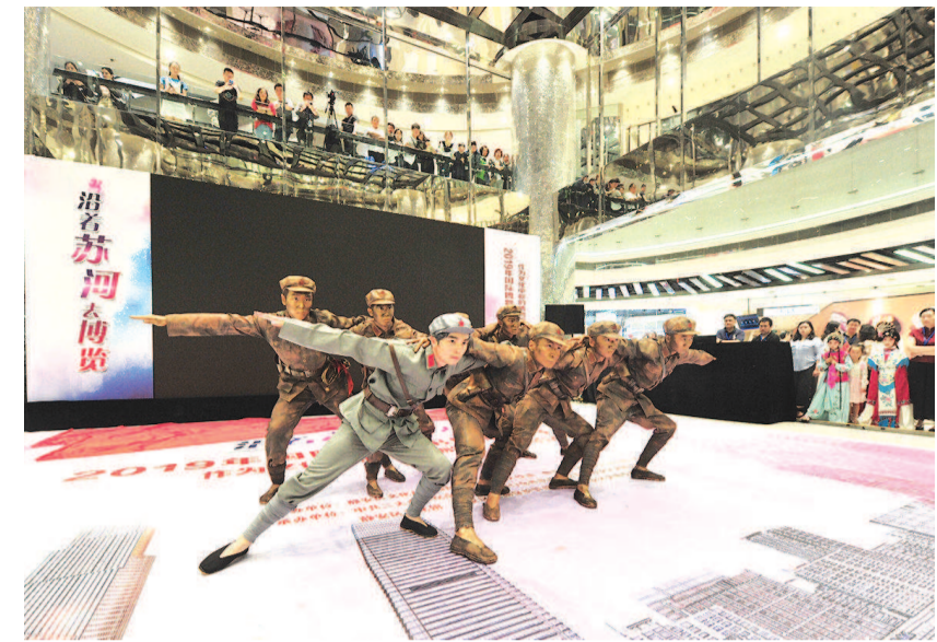
在静安大悦城商场内,一场别具特色的“红色快闪”日前上演