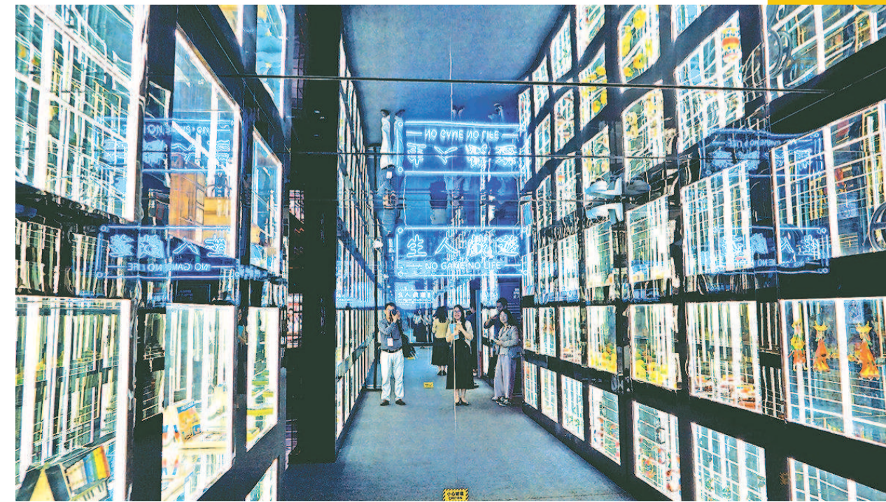
昨天,百年大世界沉浸式展演秀开启,人们在这里可以探寻上海的过去