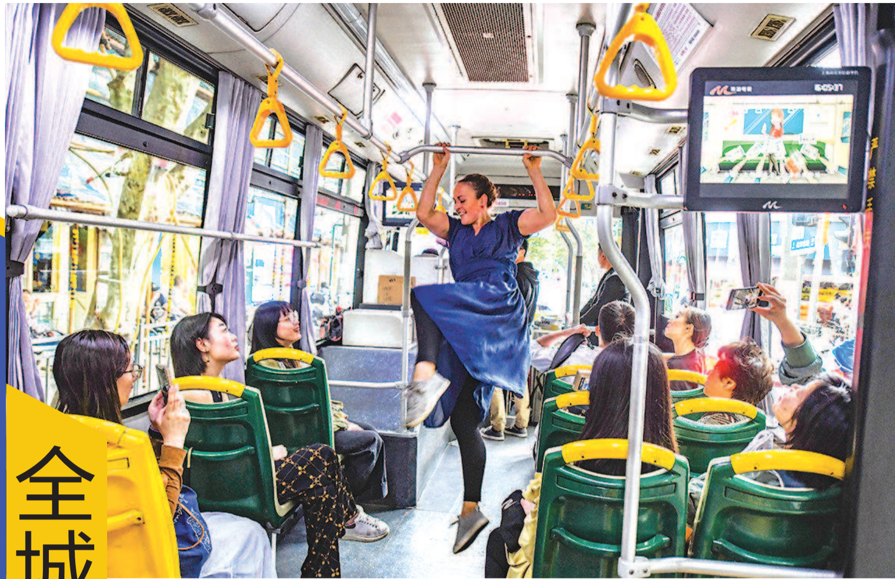
昨天下午,来自新西兰的舞剧《回到车上》在一辆公交车中上演,该剧将公交车变为剧场,乘车过程也变成了一次愉悦和艺术的独特体验