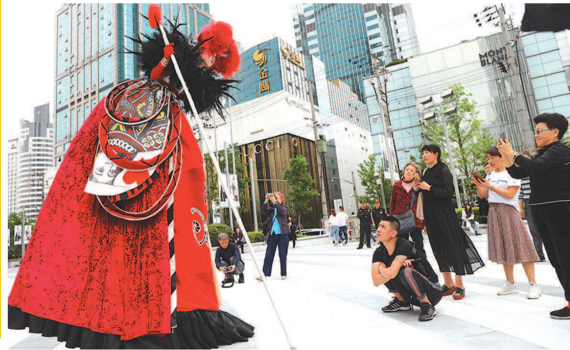
2019上海·静安现代戏剧谷期间,南京西路街头的戏剧表演吸引路人驻足