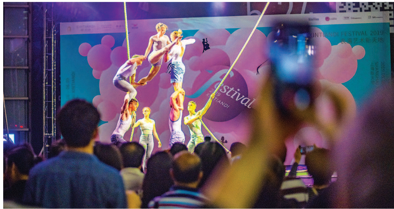
昨晚,新天地南里广场上,马戏《绳上精灵》的高难度动作令人惊叹