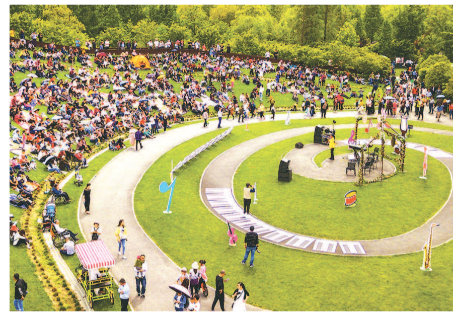
5月初,2019上海金山田园音乐会在花开海上生态园举行,鸟语花香,游人穿梭、音符交织的场景,勾勒出一幅美妙的画面