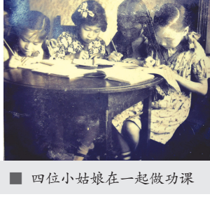
■ 四位小姑娘在一起做功课

这张老照片拍摄于上世纪 50 年代,每当傅惠琴拿起它时,心上就淌过一道暖流。照片上,四位 10 岁左右的小姑娘低着头,握着铅笔,正认认真真地在做家庭作业。这是六十多年前的一幕。