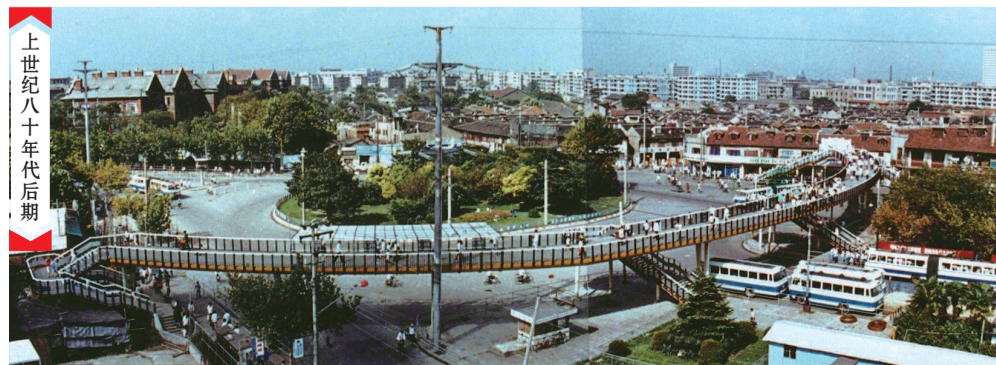
上世纪八十年代后期

2017年，伴随连廊建设，徐家汇商圈迎来自1992年首轮更新后的最大一次升级换代。徐家汇商圈空中连廊一期连通包括西亚宾馆(T20大厦)、美罗城、太平洋数码在内的主要商业体，并与现有的徐家汇天桥连通。二期则将东方商厦、港汇广场打通，三期完工后形成闭环，并延伸至今年开业的徐家汇国贸中心ITC。“巨无霸”级空中连廊，串联起徐家汇未来的商业图景，成为交通更便捷、购物更舒适、环境更美观、生态更协调的城市中央活动区。