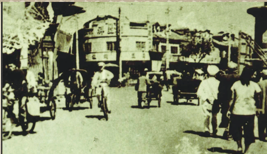
上世纪30年代 徐家汇华山路口

上世纪90年代初，为了配合地铁1号线工程建设，衡山路、华山路上的23家商店被拆除，再利用当地肇嘉浜路、漕溪北路、华山路、衡山路、虹桥路、天钥桥路、天平路等多条道路交会的独特环境，以徐家汇广场绿地为中心，打造、提升了一批商业体。从