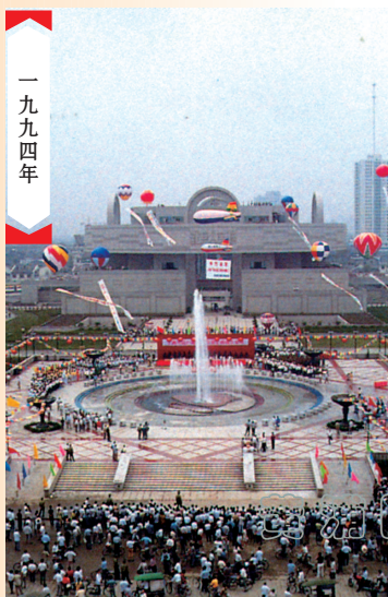
▲ 人民广场综合改造工程竣工仪式

新老照片的拍摄点均在新昌路附近，最引人注目的就是那座带有折衷主义和古典主义风格的钟楼，昔日的跑马总会大楼。每逢整点报时，钟声向西可以传达至现在的静安寺附近……70年前，这座高 53.5 米的钟楼是上海的地标性建筑之一，钟楼四面镶嵌有圆形直径 3.3 米的大钟，钟楼顶与大钟之间是瞭望台。