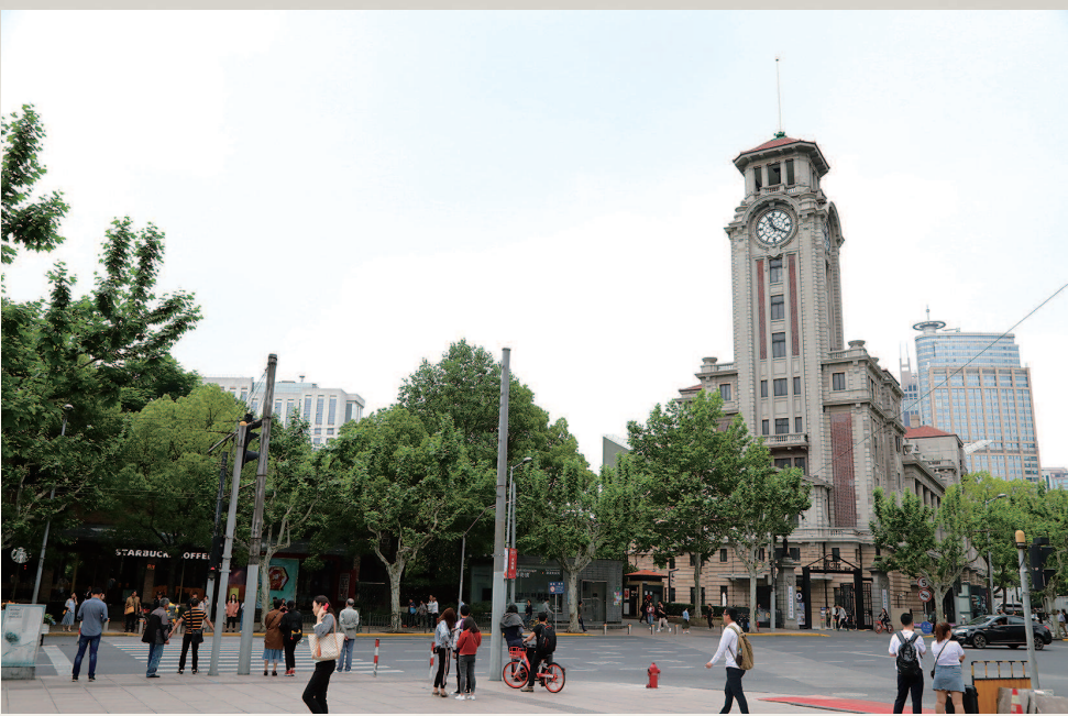
2019 上海市历史博物馆