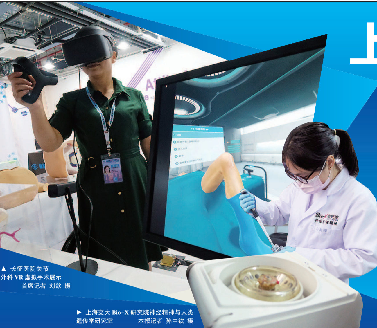
▲ 长征医院关节外科VR虚拟手术展示