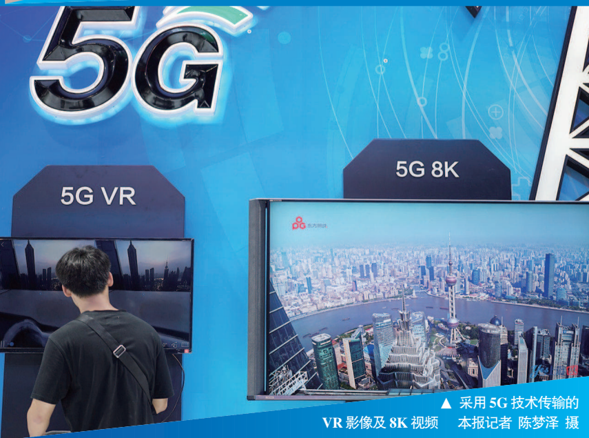
▲ 采用5G技术传输的VR影像及8K视频