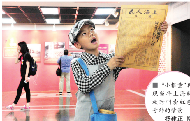
“小报童”再现当年上海解放时叫卖红色号外的情景

“大上海解放了。”“小报童”在庆祝上海解放70周年文物图片展上为观众派发的《上海人民》号外版（复制品），让不少观众如获至宝。“这样的展览不仅让我了解到了70年前上海解放的众多细节，更获得了这么珍贵的红色文创产品，真是不虚此行。”市民王小姐说。