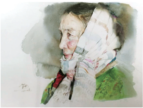
内蒙古额吉 (水彩画) 蒋智南

在我姐姐的记忆中，婆婆纳鞋底用的麻线，是她后弄堂墙边一条尺把宽的泥地上种了麻，用麻的茎晒干搓成的。她还让我们给她采桑叶，在家养蚕，让蚕结茧，煮茧抽丝，再把各种花揉碎取汁，给丝染色，在房间里搭起