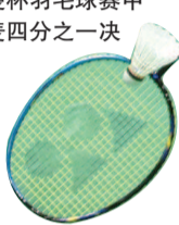
■ 安世英年 纪虽小,球技已 经很出色 本版图片 IC