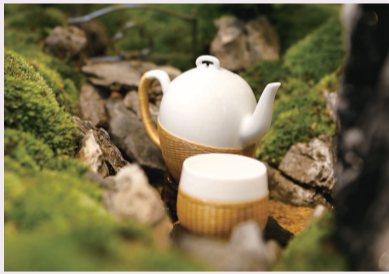
昆剧《浮生六记》衍生品