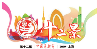
第十二届中国艺术节 2019·上海

带着“小笼包”来参加十二艺文创展,是不是来错了地方? 卖小笼包应该去食品展才对? 其实不然。