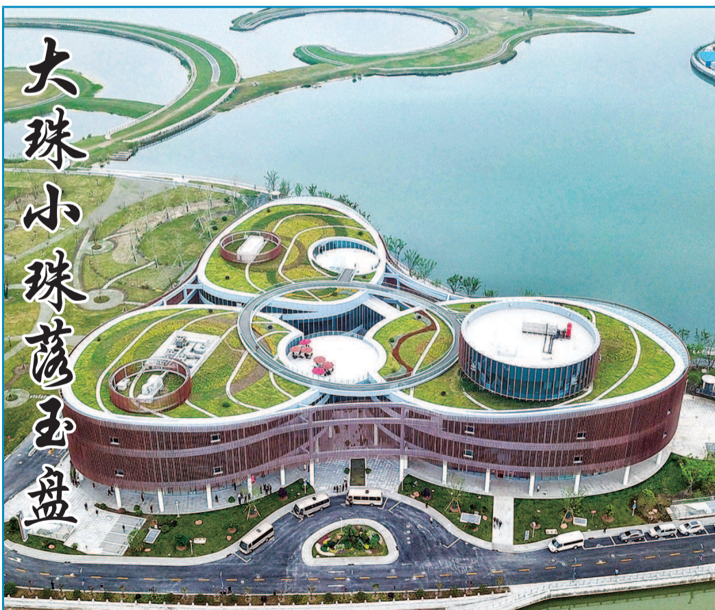
“5·18”国际博物馆日之际,沪上博物馆再添新成员。“上海之鱼”金海湖畔,仿若“大珠小珠落玉盘”的奉贤博物馆新馆,近日正式投入运营。开馆展览展出一百二十余件故宫收藏的雍正时期珍品,吸引市民参观。