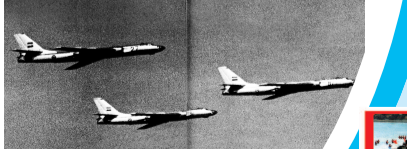
▲ 埃及空军图-16轰炸机参加1967年开罗阅兵