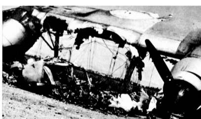
▲ 被伊拉克空军击毁于卡法·斯尔金机场的以军诺德-2501运输机

身处第一线的约旦空军无所作为，伊拉克空军却成为阿拉伯世界首先从空中反击的力量。5日中午12时15分许，伊拉克西部沙漠里的H-3基地起飞了第6中队的八架英制猎人机，其中五架攻击以色列中部的卡法·斯尔金机场，那里是以军运输机和伞兵的大本营，三架攻击特拉维夫的卢德机场（今本-古里安机场）。伊拉克机群以低空飞行躲开以色列雷达侦察，攻击卡法·斯尔金机场的五架猎人机分成两拨，最前面三架抵达时，以军毫无防范，不仅没有一架飞机拦截，连高炮都没开一炮，伊军抓住机会，俯冲发射72枚火箭弹，摧毁七架美制C-47和法制诺德-2501运输机。