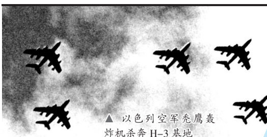
▲ 以色列空军秃鹰轰炸机杀奔H-3基地