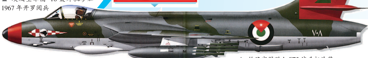
▲ 约旦空军猎人F73战斗机涂装