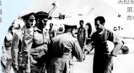
▲ 伊拉克空军在开战前夕接待埃及空军代表团

几架苏制米格-21FL歼击机，防御能力得到加强。当秃鹰机临近H-3时，两架米格-21FL升空拦截，尽管伊拉克飞行员竭力阻止以机靠近，而且米格-21FL机动性也好于秃鹰，无奈的是，米格-21FL没有航炮，仅有的R-3S空空导弹又无法从岩石、沙漠背景中分辨出飞机发动机排出的废气，全部错过目标，只能眼睁睁看着以机倾泻弹雨，炸毁四架歼击机和一架运输机后扬长而去。