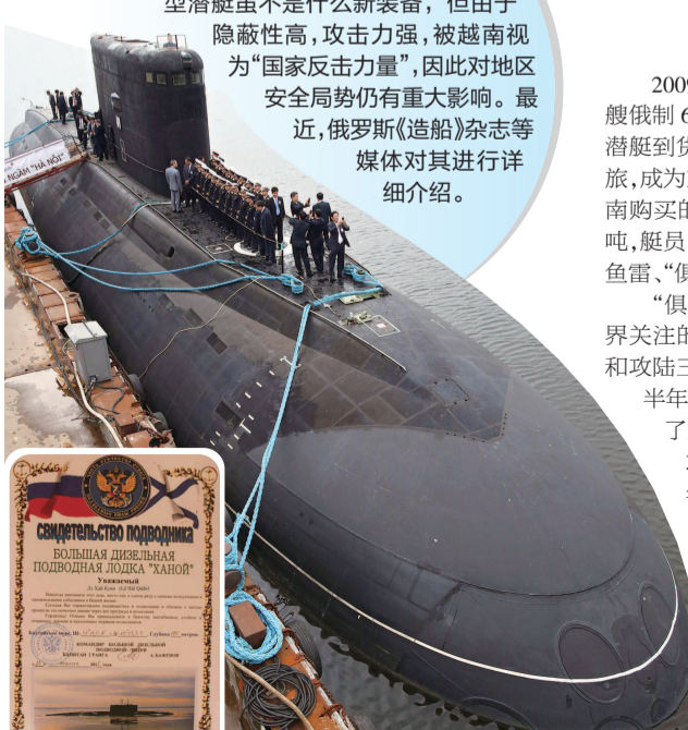
■ 越南海军潜艇“河内”号交付

一直以来, 越南海军第 189 潜艇旅都是周边各国的重点关注对象, 该旅装备的 6 艘 636.1 型潜艇虽不是什么新装备, 但由于隐蔽性高, 攻击力强, 被越南视为“国家反击力量”, 因此对地区安全局势仍有重大影响。最近, 俄罗斯《造船》杂志等媒体对其进行详细介绍。