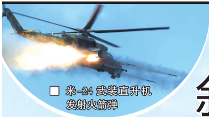
■ 米-24 武装直升机 发射火箭弹

本报时政新闻中心主编 | 第 541 期 | 2019 年 5 月 13 日 星期一 本版编辑: 吴 健 视觉设计: 竹建英 编辑邮箱: wujian@xmwb.com.cn