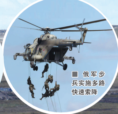
■ 俄军步兵 实施多路 快速索降

近日, 俄军在高加索南奥塞梯地区举行演习, 首次演练用直升机运送摩托化步兵而非正宗空降兵的空中突击。紧接着, 俄军又在其他山地演习中重复了该科目。塔斯社称, 这意味着经过叙利亚战火考验的俄军决心改变传统步兵接敌作战方式。