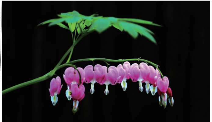
荷包牡丹

时间,是一柄折扇,我是这扇面上的一只蓝闪蝶。林间蓝色的幻影,不会去看树的年轮。我也渐渐不再注意,哪儿是扇骨。时间,是一柄折扇,或以空白示人,或赋以诗,绘以画。一柄折扇,两个画面,在现实与过往之间,让我那绚丽的翅羽像鸟翼,在翩翩起舞中,游离于时间之外!