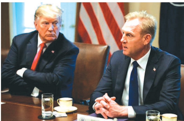
沙纳汉(右)与特朗普

据美国媒体报道,沙纳汉是美国创建“太空军”的主要支持者之一,在特朗普政府制订新版美国国家安全战略报告过程中发挥了重要作用,并坚定支持特朗普在美国和墨西哥边境修建隔离墙的政策。