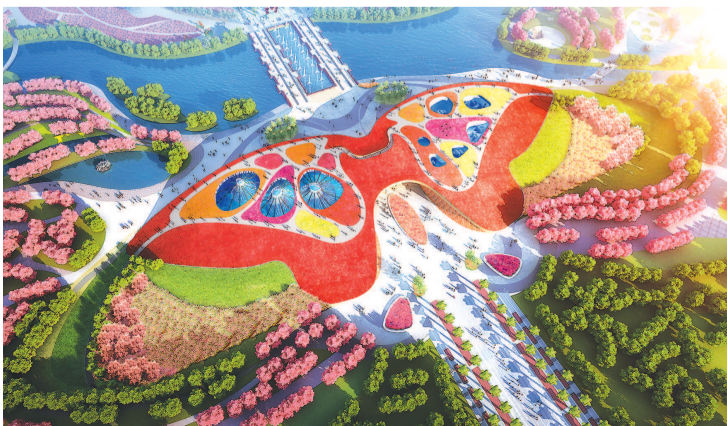
■ “彩蝶扑牡丹”大地盛景效果图

本报讯（首席记者 范洁）“三区、一心、一轴、六馆、六园”的功能布局错落有致，“彩蝶扑牡丹”的大地盛景绵延千亩花田……今天上午，第十届中国花卉博览会园区建设奠基仪式在崇明举行，标志着经过一年多的精心筹备，花博会从策划准备阶段进入全面实施阶段。