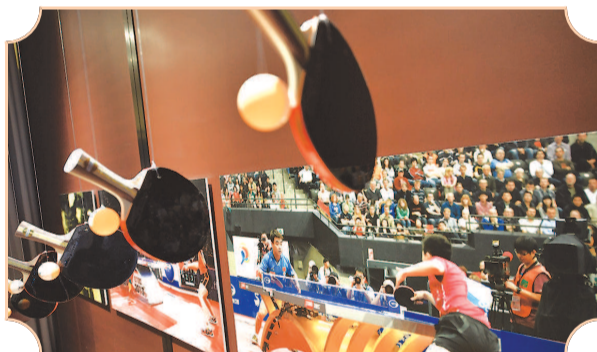
■ 红双喜乒乓球拍展示区