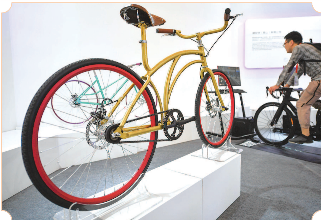
■ 售价 39999 元的凤凰牌纪念车，代表中国自行车工艺的最高水准